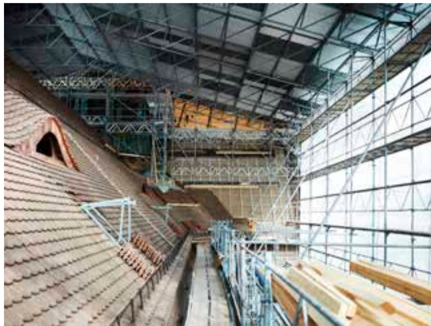
Erfahrene Handwerker haben das Dach und die Fassaden der Kirche originalgetreu und mit viel Liebe zum Detail renoviert.

Die alten und beschädigten Biber-schwanzziegel wurden durch neu gefertigte Ziegel ersetzt. Die speziell für dieses Projekt entwickelte Rezeptur ist den Originalziegeln nachempfunden. So konnte die Tonalität der neuen Dacheindeckung gut an den Bestand angeglichen werden. Nebst geraden Ziegeln wurden auch konvex und konkav geformte Module hergestellt, um die vorhandenen Dachdetails originalgetreu ausbilden zu können. Brüchige und lecke Kupferblecheindeckungen wurden ersetzt,