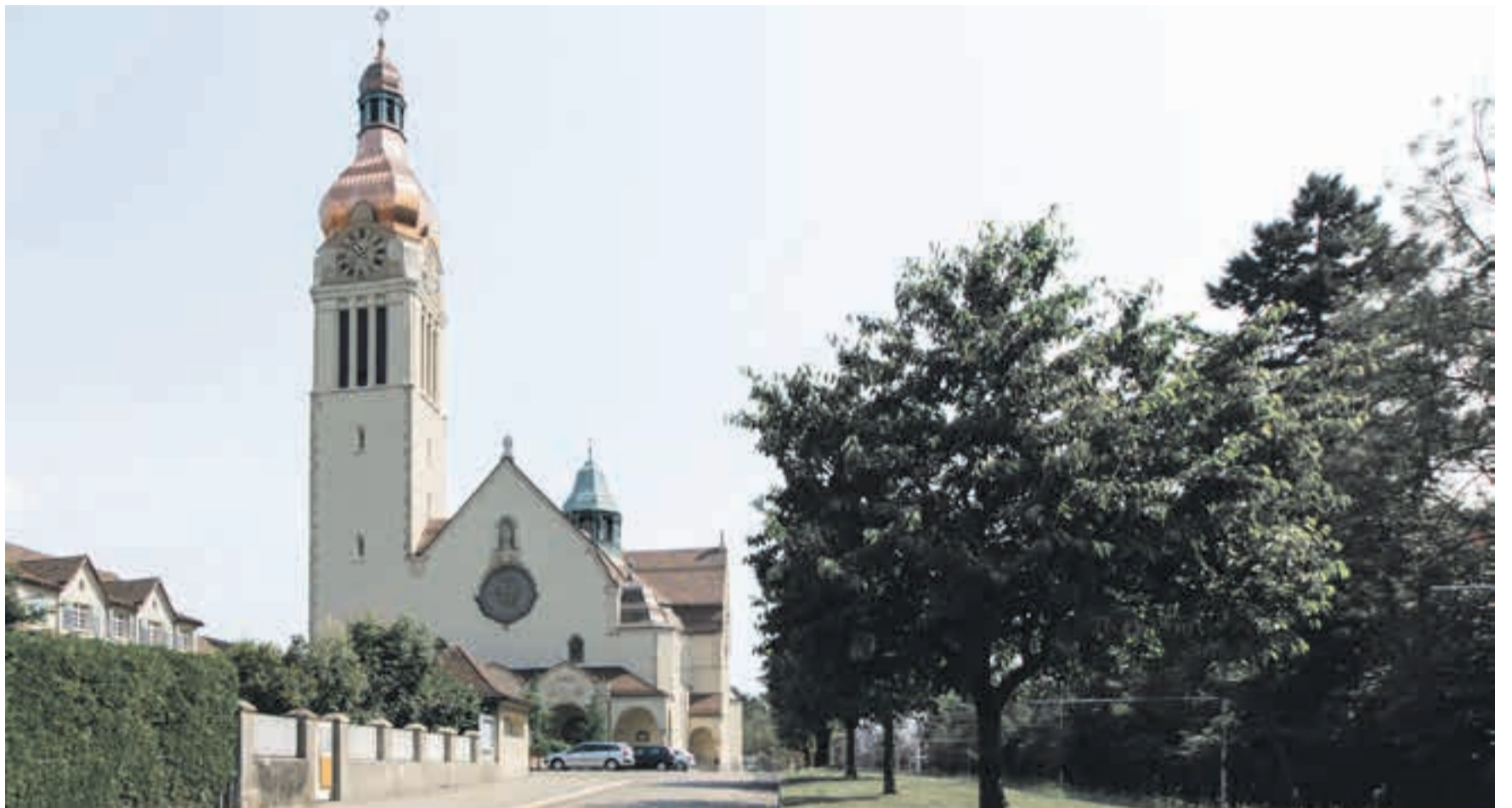
Mit einem grossen Fest wird die abgeschlossene Aussenrenovation der 100-jährigen Kirche gebührend gefeiert.